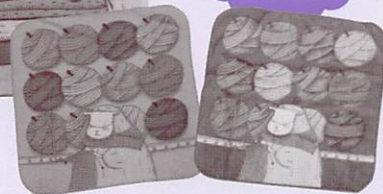
ミニタオル2枚セット