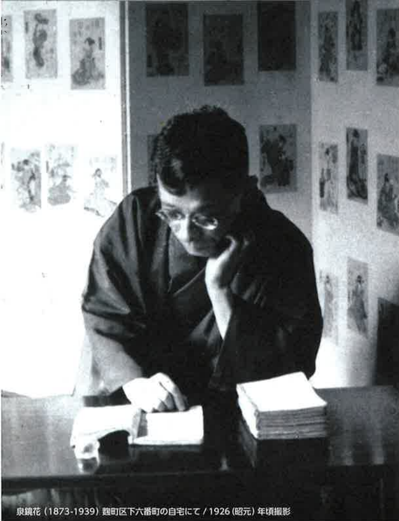
泉鏡花 (1873-1939) 麹町区下六番町の自宅にて / 1926 (昭元) 年頃撮影